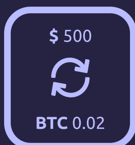
Платежный шлюз OWNR